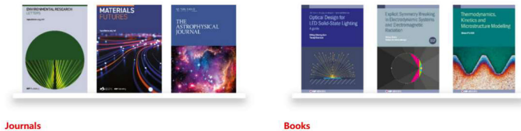
图1 IOP出版商 (IOP Publishing) 官网截图 (Publications - IOP Publishing)。

With over 140 years of working in partnership with international research communities and prominent scientific bodies, our core values of rigour and integrity are reflected in all our publications – providing you with access to the highest standard of scholarly communications.