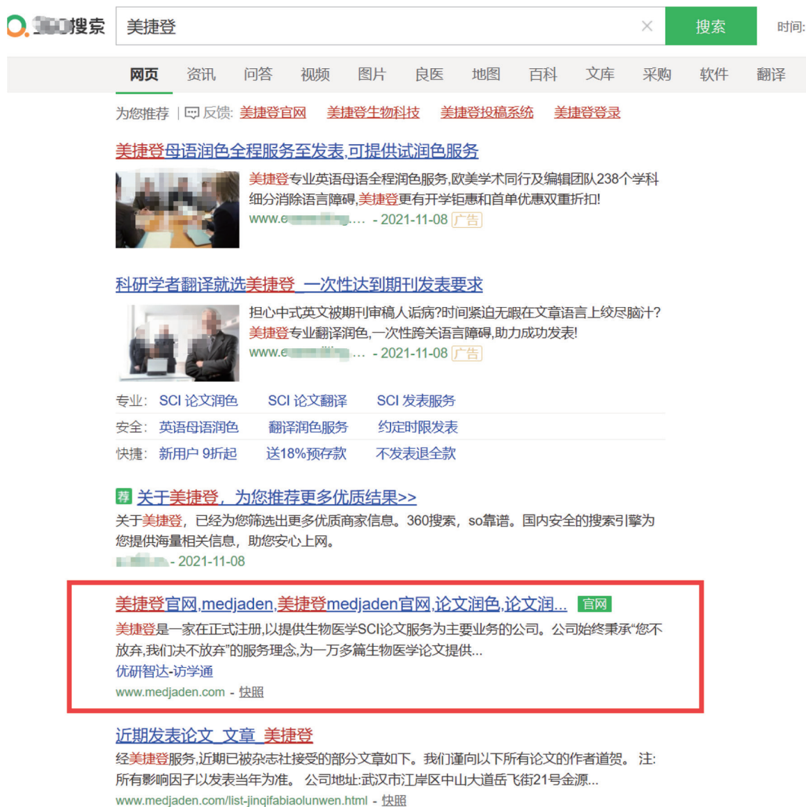
图18 通过某搜索引擎输入“美捷登”，发现排名靠前的几个网站均打着“美捷登”的旗号在进行宣传，而真正的“美捷登”官网则排到了第四位。

比 2019 年增加了 4.1%，其中收录的中国科技论文为 55.26 万篇。各个国家投稿论文的数量在不断增加，给期刊编辑和审稿人都带来了持续的压力。另外，随着同行评议压力的增加，期刊对论文质量的要求也在提高。许多期刊编辑建议非英语母语国家的作者寻求英文编辑服务，甚至部分出版集团建立了能为作者提供论文编辑服务的机构，如爱思唯尔集团的语言服务 (Elsevier Language Services)、Kowsar 集团的英文编辑服务 (Kowsar English Editing Service) 和 Wiley 集团的英文语言编辑服务 (Wiley