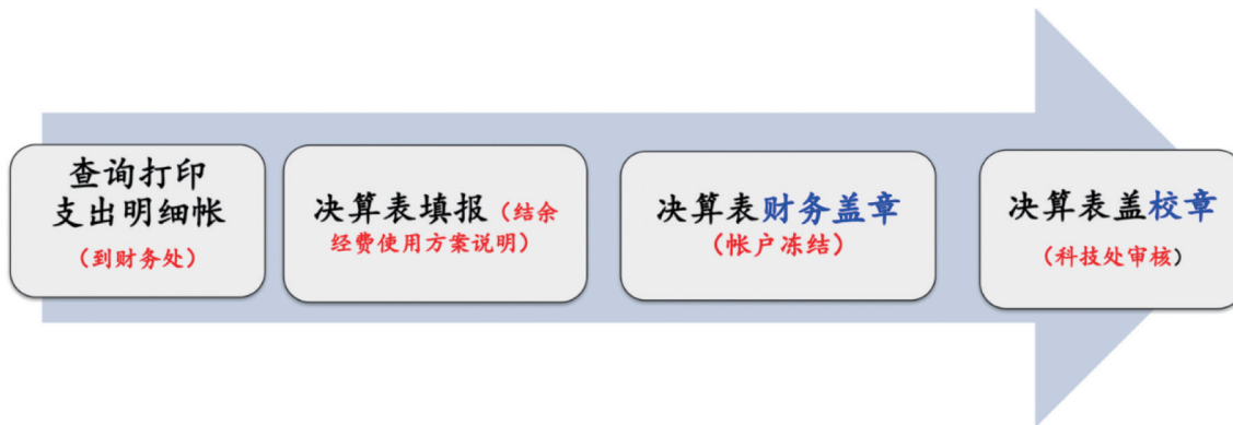
图3 决算表填报（大致）流程。