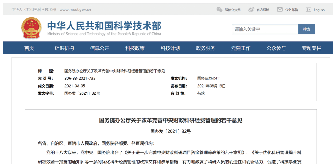
图4 科技部发布《国务院办公室关于改革完善中央财政科研经费管理的若干意见》。

避免突击花钱,《若干意见》进一步改进结余资金管理。一是放宽留用政策,超过两年后也不再收回。明确项目完成任务目标并通过综合绩效评价后,结余资金留归项目承担单位使用,不再收回,由单位统筹安排用于科研活动的直接支出,优先考虑原项目团队科研需求。二是提高资金使用效益。要求项目承担单位加强结余资金管理,健全结余资金盘活机制,防止结余资金规模过大,加快资金使用进度。