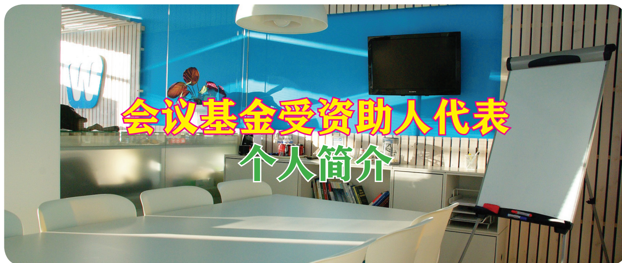
潘雄飞 美捷登2014年会议基金获得者 基金编号MJC20140321