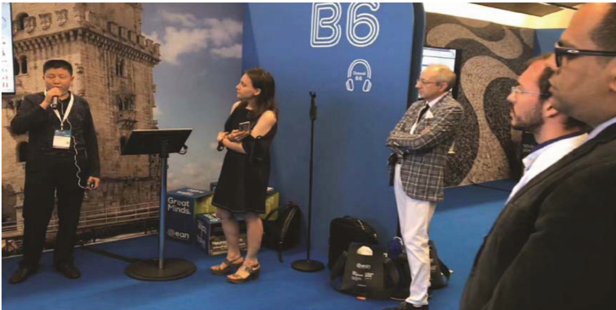
图1 我老板在本次会议中展示电子壁报。

我抱着试一试的态度给贵公司提交了基金的申请，没想到第二天就有老师加我微信，仔细的问了