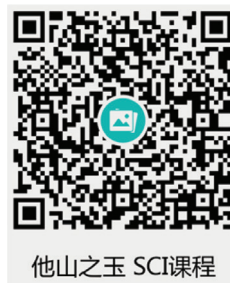
他山之玉 SCI课程 扫码试听

2016年美捷登依托学院资源，制作了一部针对性强、专业度高的《SCI论文写作系列课程》视频，名为《他山之玉-SCI论文写作系列课程》，总时长500分钟。由四位著名教授提供全方位的SCI论文写作深入指导。包括论文撰写前的素材收集及准备、撰写过程中的各个方面以及论文投稿与发表的各种写作技巧。截止到2020年3月，此课程已售出上百份，受到科研工作者广泛好评。