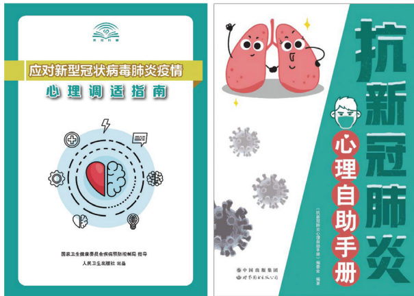
图2 国家卫健委与人民卫生出版社推出《应对新型冠状病毒肺炎疫情心理调适指南》与世图公司关注心理健康推出《抗新冠肺炎心理自助手册》。

[6]。省级人民政府负责组织、协调、执行国务院指导下的突发公共卫生事件处置、信息公开和应急物资、设施收集等工作。对于卫生保健部门，除了临床与公共卫生干预之外，公共心理障碍和实施心理危机干预也包括在一级应对措施中。国家卫健委发布了针对 SARS-CoV-2 爆发期间促进对患者、医务人员和医疗观察人员的心理危机干预指导方针 [7]。北京大学目前正在为公众准备一本心理健康手册，描述如何应对 SARS-CoV-2 爆发所带来的压力和其他心理问题 [8] (图 2)。