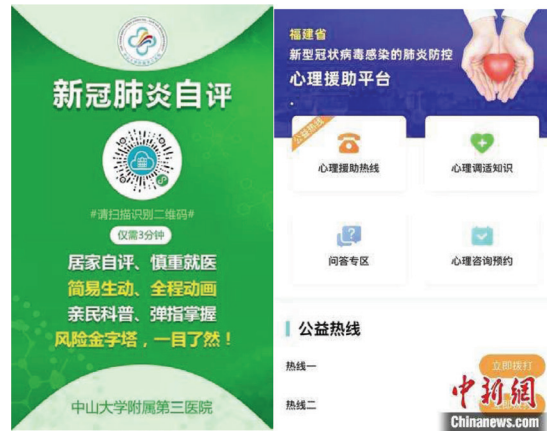
图3 互联网和社交媒体(如微信，微博等)上应对心理压力的软件与平台。

因此，将精神卫生保健纳入国家公共卫生应急系统将使中国和世界在遏制 SARS-CoV-2 的战“疫”中获得更有力的支持。