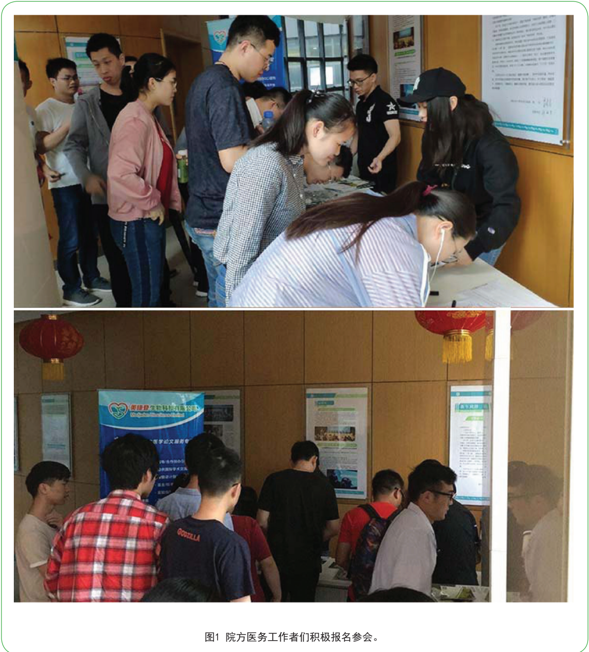
图1 院方医务工作者们积极报名参会。