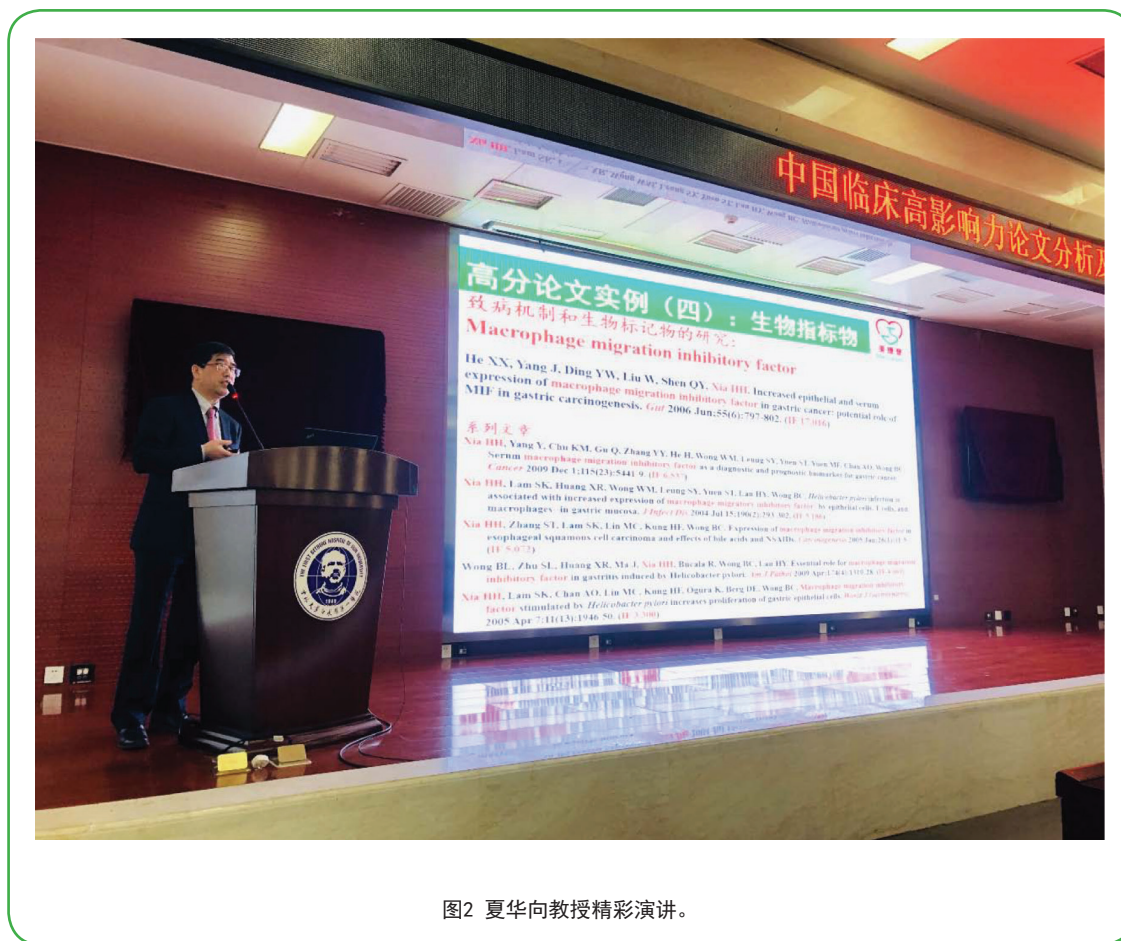
图2 夏华向教授精彩演讲。

研发展和兴起，回首 2008 年仅为个位数的 SCI 论文产出量，到如今 SCI 论文总数量在全国医院中排名前 10 位，并分别在 N Engl J Med 、 Nature 、 JAMA 发表了 4 篇 IF 超过 40 分 的文章。如此优秀成绩值得庆贺，但吉林大学第一医院的科研人员并没有就此停下脚步。为了能够帮助科研人员达到更高目标，发高质量 SCI 文章，本次讲座特邀请到美捷登主编夏华向教授，通过围绕主题“中国临床高影响力论文分析及发表策略”为大家进行讲解，旨在帮助吉林大学第一医院科研人员开拓科研思路，在多发表的前提下提升论文质量。