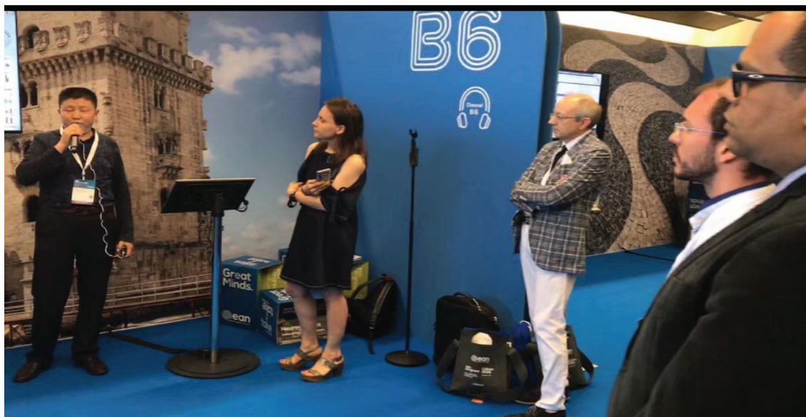
图1 我老板在本次会议中展示电子壁报。

是咖喱鸡块和蘑菇酱鸡块，鸡肉果然是各个民族都可以吃的食物，可是为什么一看到咖喱我就想起了阿三的一个梗……接下来的几天会议，老板都是晚上提前找好了想听的内容，确定在哪个会场，然后我们一起去听，会上老板各种互动，各种举手，我看他举手我