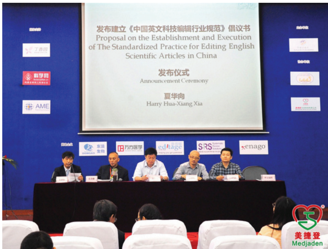
图2. 2015年10月18日, 美捷登主席夏华向教授宣布成立由美捷登、长青藤、意得辑、理文编辑、LetPub、英论阁六家英文科技论文编辑服务公司组成的中国英文科技论文编辑联盟 (The Alliance for Scientific Editing in china, ASEC), 并宣读由这六家公司负责人签署的《中国英文科技编辑行业规范》的倡议书。

编撰捏造实验数据, 干扰同行评审过程, 甚至直接转让买卖论文(图3)。正是因为这些不道德公司的存在, 让绝大部分科研人员心存戒心。“论文编辑公司”在其中充当了学术不端的帮凶, 这少数害群之马, 不仅严重影响了中