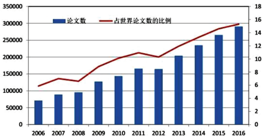
图1. SCI收录中国科技论文占世界论文总数比例的变化趋势（图片摘自《科学中国人》，2017(12Z):6-6）

然而有少数不良“论文编辑公司”号称提供英文论文编辑服务，实则“挂羊头卖狗肉”，做着