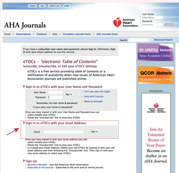
图 2. 填写 Email 地址

注意红色方框的地方，实际上是让你填写你的 Email 地址（图 2）。建议大家单独注册一个邮箱来接收此类订阅的邮件。