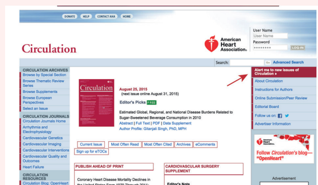
图 1. 进入 Circulation 的主页